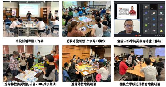
南投縣輔導團工作坊