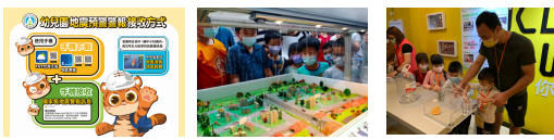
幼兒園地震警報接收方式