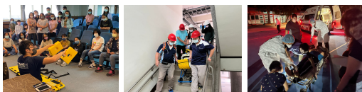
研習課程-防災器具使用