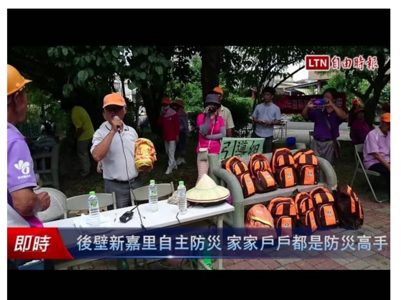
即時 後壁新嘉里自主防災 家家戶戶都是防災高手